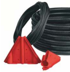
HB [UL94] krytí systému IP54