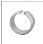
OHT* str. 28

ØD je rozměr samotné hadice - pro celkový průměr je potřeba připočíst 1,5mm na oplet.