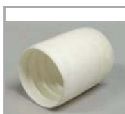
BTP str. 32