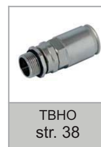
TBHO str. 38